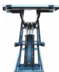
Cremallera de seguridad cilindro alta resistencia.