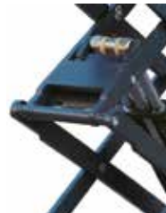
Estructura con pistón reforzada.