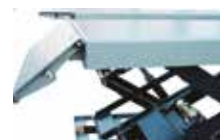
Extensión de plataforma felxible.