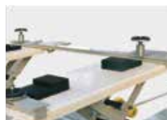
Opcional: Kit soportes 4x4